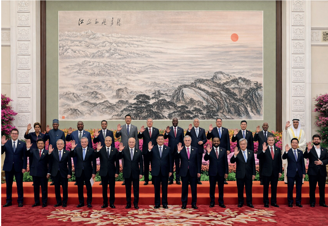
"Kitap, ileriye dönük olarak KYG kapsamındaki güvenliği şekillendiren gelişmeleri de incelemektedir." 17-18 Ekim 2023 tarihlerinde Pekin'deki 3. Kuşak ve Yol Uluslararası İşbirliği Forumu'nda liderler (Fotoğraf: BRF, 2023).

Bununla birlikte, kitabın kurumsal betimlemeye odaklanması, teorik katkısını sınırlamaktadır. Arduino, Çinli ÖGŞ'lerin Batılı muadillerinden nasıl farklılaştığını etkili biçimde ortaya koysa da analiz, güvenlik yönetişimi